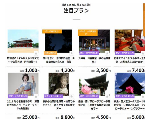
着地型観光商品の造成 ④