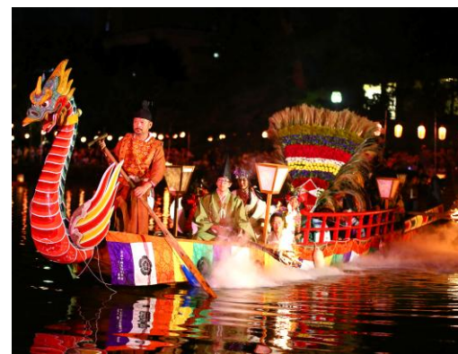
伝統行事の保護支援 ③ (写真/采女祭)