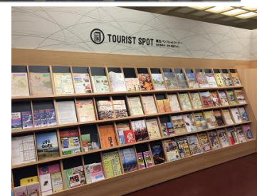
観光案内所の運営 ①