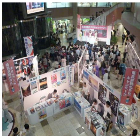
観光プロモーション活動 ②