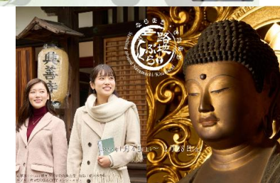
季節ごとのキャンペーンの実施 ②