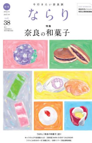
観光情報誌の発行 ①