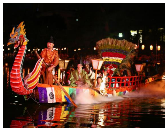
伝統行事の保護支援 (写真/采女祭) ③