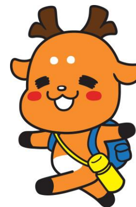
マスコットキャラクター「しかまるくん」の活用 ④