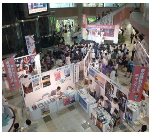
観光プロモーション活動 ③