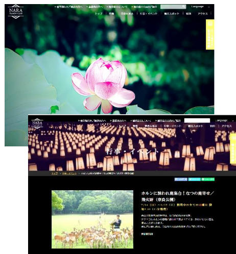
奈良市観光Webサイトの運営 ②