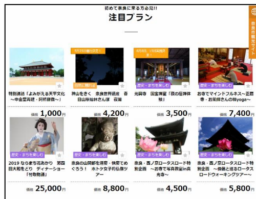
着地型観光商品（ツアー等）の企画造成 ①