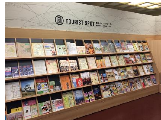
奈良市総合観光案内所内のパンフレットコーナーへ会員様のチラシを設置※②

※JNTO認定外国人観光案内所として、幅広い観光情報の提供が優先されるため、会員様のチラシ設置スペースには限りがあり、配架できないこともございます。なにとぞご理解・ご了承ください。