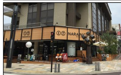
上) 奈良市総合観光案内所 下) 奈良市観光センター「ナラニクル」(無人) ②