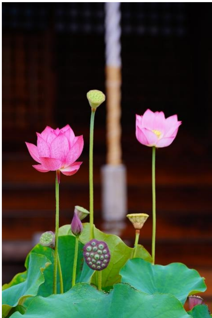
タイトル「蓮華合掌」