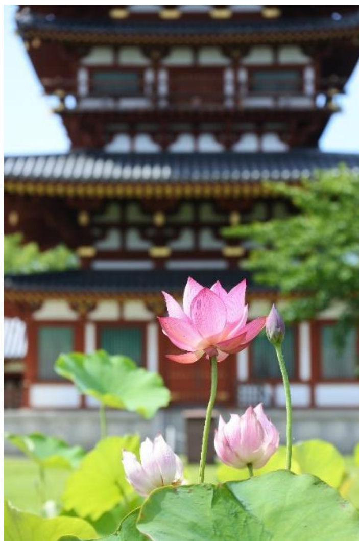
タイトル「西塔と蓮」