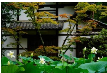
タイトル「王子蓮乱れ咲き」