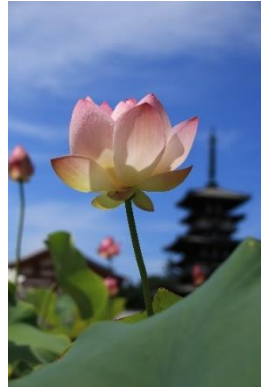
タイトル「晴天に映える」