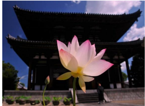
タイトル「本堂彩る」