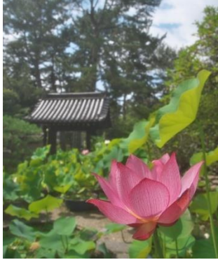
タイトル「古門の夏」