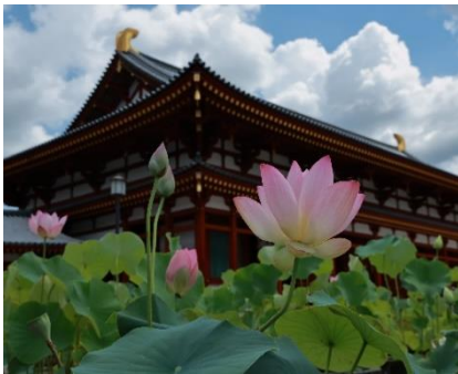
タイトル「薬師寺の蓮」