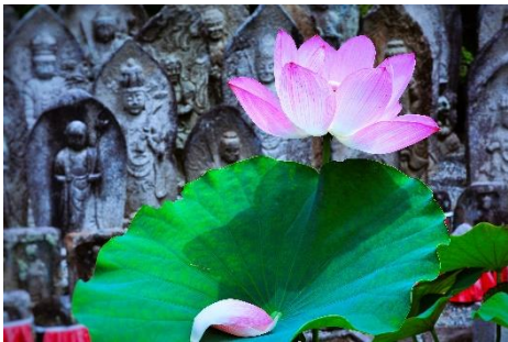
タイトル「石佛に祈り捧げる蓮の花」