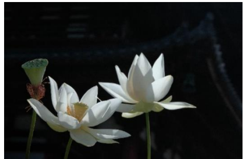
タイトル「喜光寺の白蓮」