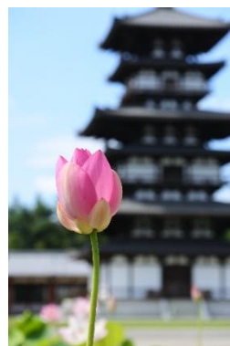
タイトル「東塔と蓮」