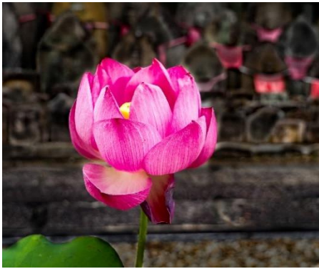
タイトル「静寂の時」