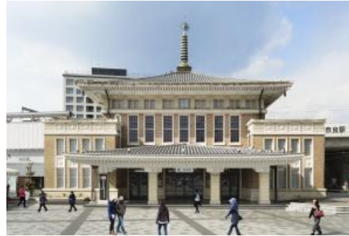
奈良市総合観光案内所（JR奈良駅前）