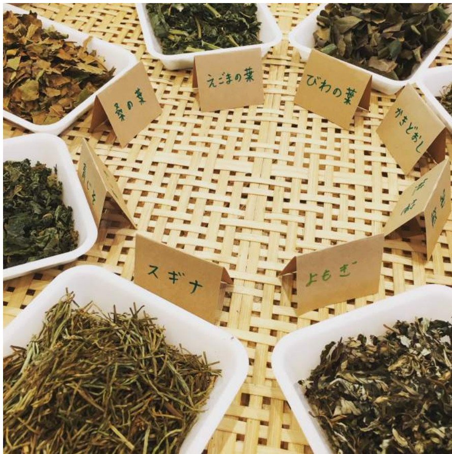
こちらは、本日の野草8種類。桑の葉、えごまの葉、びわの葉、かきどおし、熊笹、よもぎ、スギナ、青しそ。