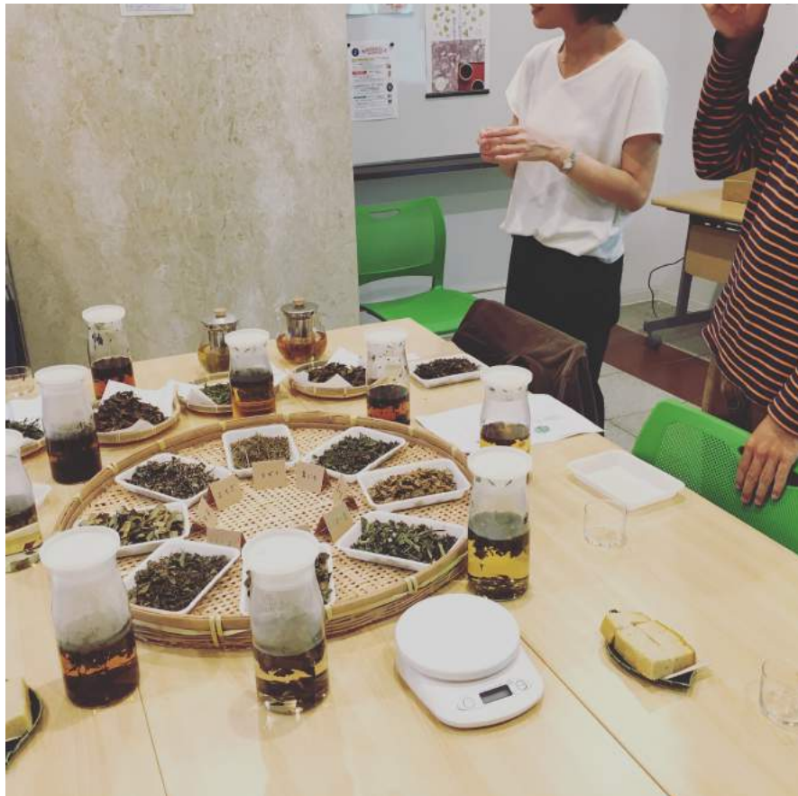
テイスティング中。参加者の方も席をたちながら、わいわいがやがや、そして真剣にそれぞれのお茶の風味を楽しんでいただきました。