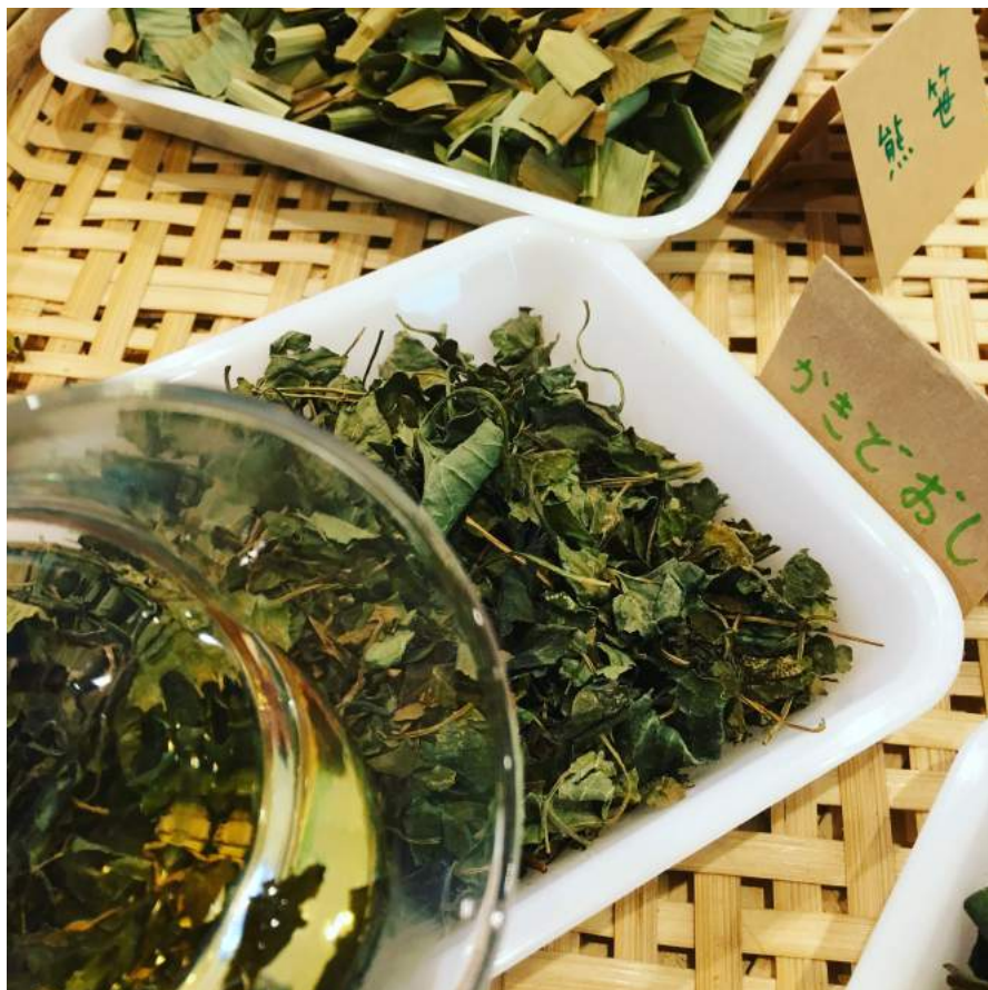
「かきどおし」をテイスティング。ミントのような爽快感。