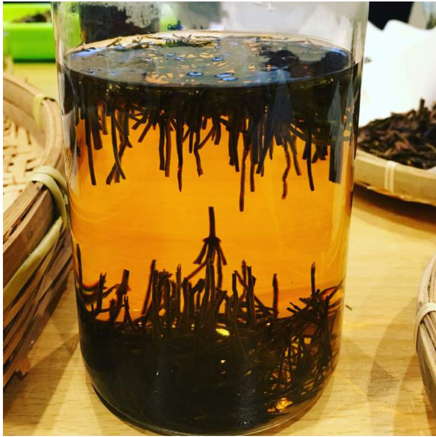
「スギナ」のお茶。すっきり飲みやすい。普段は雑草としか思えないものが、こんな味だなんて！