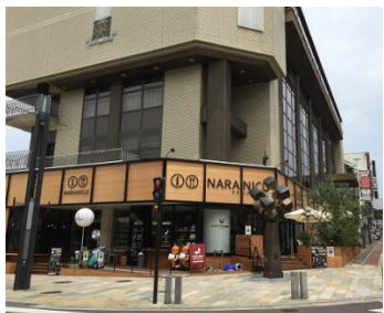
上) 奈良市総合観光案内所 下) 奈良市観光センター ②