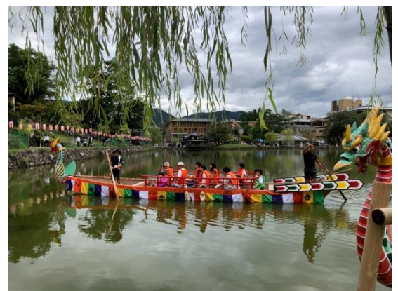
過去の乗船体験の様子