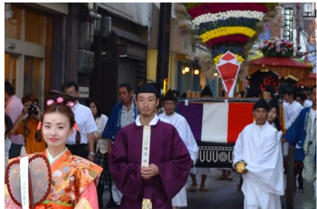
写真左：猿沢池で行われる管絃船の儀、右：花扇奉納行列 ※両写真とも過去の様子

采女祭は奈良市・猿沢池の北西に位置する春日大社の末社「采女神社」の例祭。室町時代以降の約600年間、奈良市の伝統行事として受け継がれています。奈良時代に帝の寵愛を受けていたある采女（後宮で帝の給仕をする女官の職名）が帝の寵愛が薄れたことを嘆き猿沢池に身を投じたことから、その霊を慰めるために采女神社が建てられたと平安時代中期の歌物語『大和物語』に書かれており、現在は命日の時期とされる中秋の名月に宵宮祭と本祭が執り行われています。