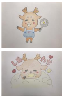
作品例： 第2代 NARA CITY コンシェルジュの動画より

しかまろくんのイラストを描き、その写真またはスキャン画像をメールに添付してご応募いただくと、しかまろくんが10作品を厳選。選ばれた10名様にはしかまろくんグッズをプレゼントします。さらに、しかまろくんの新しいLINEスタンプにアイデアが採用されるチャンスもあります。