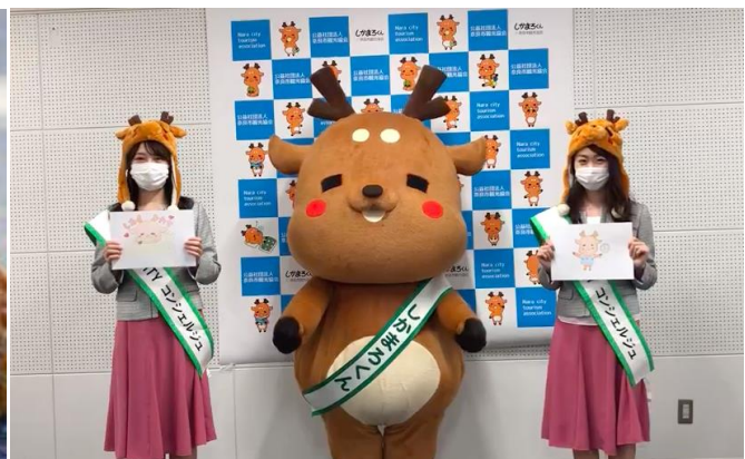
画像左：キャンペーンには奈良の鹿をテーマにした企画が盛りだくさん 右：第2代 NARA CITY コンシェルジュの動画より