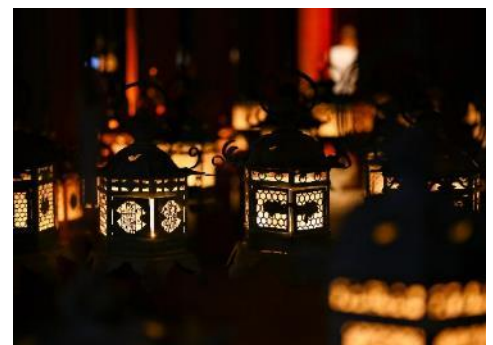
万燈籠のイメージ