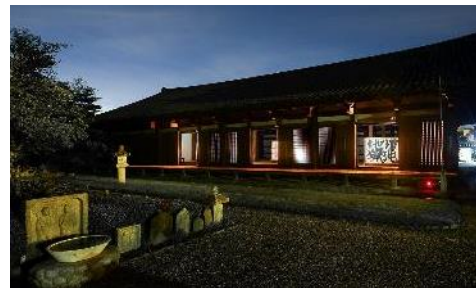
画像左：東大寺大仏殿の夜間イメージ（写真提供：東大寺、撮影：三好和義） 右上：万燈籠のイメージ（春日大社） 右下：開扉された国宝・禅室のイメージ（元興寺）

11 月の毎週末は、東大寺（金曜）、春日大社（土曜）、元興寺（金曜・土曜）で夜の特別参拝が行われます。東大寺大仏殿では、18:00 から新型コロナウイルス終息を祈る読経、18:30 からは大仏様への奉納演奏が行われます。春日大社では、御本社回廊内にある約 1,000 基の釣燈籠に浄火が灯され、幻想的な雰囲気の中、参拝が可能。元興寺では、国宝・極楽堂（本堂）の夜間特別参拝とともに、普段は非公開の国宝・禅室の一部の扉を開扉し、元興寺秘蔵の須田剋太画伯の大作品が灯りに照らされます。世界遺産の社寺で厳かな空気に包まれ、まさに心が洗われるような体験を味わうことができます。