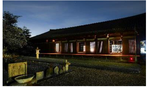
開扉された国宝・禅室のイメージ

内容： 11月の毎週金・土曜日の夜、元興寺では、暗闇に浮かぶ国宝・極楽堂（本堂）の堂内を特別に参拝ができます。また、普段は非公開の国宝・禅室の一部の扉が開扉され、堂内に展示された秘蔵の須田剋太画伯の大作品が灯りに照らされます。