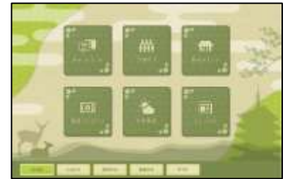
デジタルサイネージメニュー画面

配信内容： 操作時…混雑状況、観光スポット、 トピックス（旬のイベントなどの情報）、 動画ライブラリー、気象情報 非操作時…観光プロモーション動画等