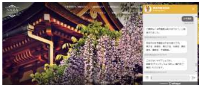
観光協会ウェブサイト上でのチャットボット画面

旅行前や旅行中等でのタイムリーかつ効率的な情報収集がインターネット上で行えるよう、奈良市観光協会ウェブサイトにて AI による対話型の観光案内（チャットボット）を設置。日本語を含む 5 言語に対応しており、スマートフォンなどを利用すると、LINE や Facebook Messenger、WeChat 等のメッセージングアプリケーションでも使用できます。