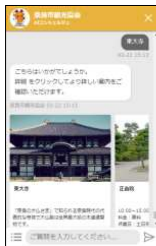
モバイル上でのチャットボット画面

※紹介動画掲載の二次元コード、または公式サイト上からチャットボットにアクセスできます。