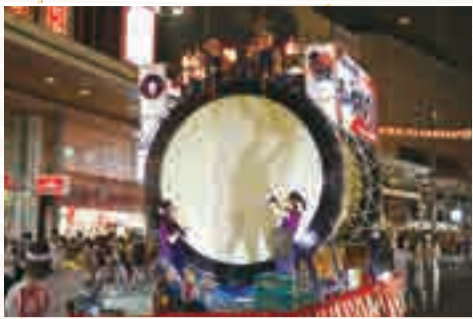
2022年「郡山うねめまつり」の様子

昭和46年、奈良市と郡山市は、それぞれに「采女伝説」が伝わっているご縁により、姉妹都市提携を結び50年以上になります。郡山市では、毎年8月上旬に「郡山うねめまつり」が開催され、市内の駅前大通りでは大勢の浴衣姿の市民らで賑わう「うねめ踊り流し」が繰り広げられるなど盛大に行われています。