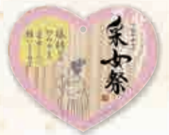
采女祭オリジナル絵馬 デザイン:妖怪書家 逢香(おうか)

企画・採女祭保存会事務局(奈良市観光協会内) Instagram/@naratourism_official 問い合わせ先 TEL:0742-30-0230(平日:9:00～17:45) Facebook/@narashikanko