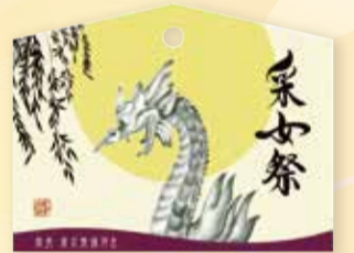
采女祭オリジナル絵馬 デザイン: 妖怪書家 逢香(おうか)