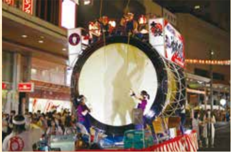
「郡山うねめまつり」の様子

昭和46年、奈良市と郡山市は、それぞれに「采女伝説」が伝わっているご縁により、姉妹都市提携を結び50年以上になります。郡山市では、毎年8月上旬に「郡山うねめまつり」が開催され、市内の駅前大通りでは大勢の浴衣姿の市民らで賑わう「うねめ踊り流し」が繰り広げられるなど盛大に行われています。