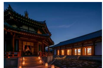
薬師寺 玄奘塔と大唐西域壁画殿

問い合わせ：0742-33-6001（薬師寺 受付 17:00 まで） URL: https://yakushiji.or.jp/