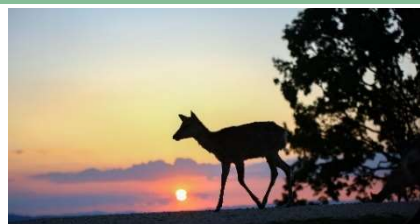
若草山山頂の夕景イメージ

※雨天時も運行しますが、夕景が見えない場合があります。また、荒天時は運休する場合があります。