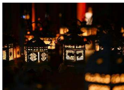
春日大社 万燈籠イメージ

問い合わせ：0742-22-7788（春日大社 受付 17:00 まで） URL: https://www.kasugataisha.or.jp/