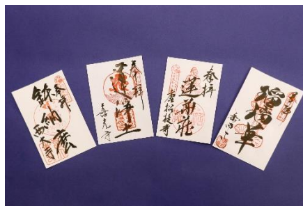
今年の四ヶ寺特別御朱印。仏教で智慧を表す色「五色」の中の「白色(生成色)」の用紙に揮毫されます