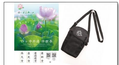
四ヶ寺共通拝観券にはオリジナルグッズも