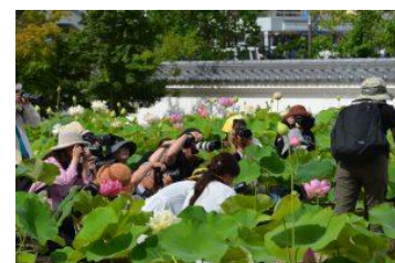
過去の写真教室の様子