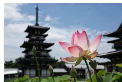
薬師寺の蓮（イメージ）

薬師寺： 天武天皇によって発願、持統天皇によって建立され、その後平城遷都に伴い今に至ります。当時の薬師寺は「龍宮造り」と謳われる壮麗な大伽藍でしたが、幾多の災害により、東塔（国宝）を除きほとんどの堂宇が焼失しました。昭和 43 年（1968）よりお写経による伽藍復興を行い、大伽藍がよみがえりました。薬師寺では約 200 鉢の蓮が境内に咲き、仏国土さながらの風景に出会えます。