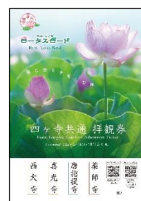
共通拝観券（イメージ）

※各寺の御朱印所では、四ヶ寺共通拝観券の提示で「奈良・西ノ京ロータスロード」だけの特別な御朱印が授与されます（別途納経料必要）。書き置きの御朱印となります。 ※四ヶ寺共通拝観券をご購入の方には、周辺地域でのお食事やお買い物にご利用いただけるクーポンも進呈します。 ※共通拝観券の子ども料金の取り扱いはありません。お子様は各寺にて子ども料金をお納めください。（未就学児は無料）