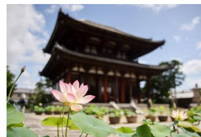
喜光寺の蓮（イメージ）

喜光寺： 奈良時代の高僧、行基菩薩が養老 5 年（721）に開創。東大寺大仏造立のための布教活動の拠点としたお寺です。行基菩薩はこの寺で入滅しました。現在は、いろは歌を書写する「いろは写経」の体験が人気です。蓮の花の季節には、約 250 鉢の蓮が境内を華やかに彩ります。