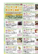
ロータスクーポン(イメージ)

特設サイト ( https://narashikanko.or.jp/topics/lotusroad/ ) では、様々な最新情報をお届けしています。四ヶ寺共通拝観券等の基本情報はもちろん、クーポン提示で様々な特典を受けることができる「ロータスクーポン」の情報も掲載予定です。「ロータスクーポン」サイトは 6 月中旬公開予定です。