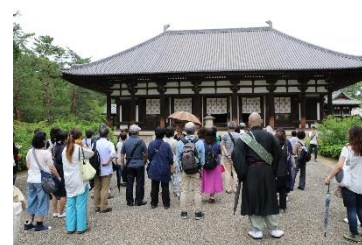
過去のウォーキングツアーの様子

行程： 7:30 近鉄西ノ京駅東口集合・受付…薬師寺…唐招提寺…喜光寺（昼食）…西大寺 15:00頃 現地解散