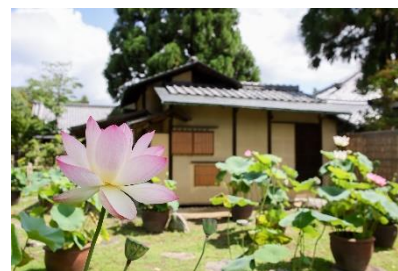
西大寺の蓮（イメージ）

西大寺： 鎮護国家を祈念する称徳女帝の勅願で天平神護元年（765）に創建。南都七大寺の一つとして大伽藍を誇り、鎌倉時代に稀代の名僧・興正菩薩叡尊上人によって真言律の根本道場として再興されました。叡尊は「興法利生」をスローガンに、西大寺を拠点として戒律復興と民衆救済に邁進。叡尊が興立した密・律一体の「真言律」の法燈を現代に伝えます。蓮の花のシーズンには、約 100 鉢の蓮鉢が境内を彩ります。